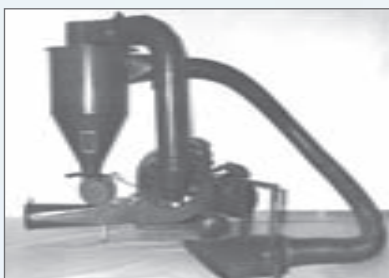
Dopravník zrna vzduchový kombinovaný DoVZK 100