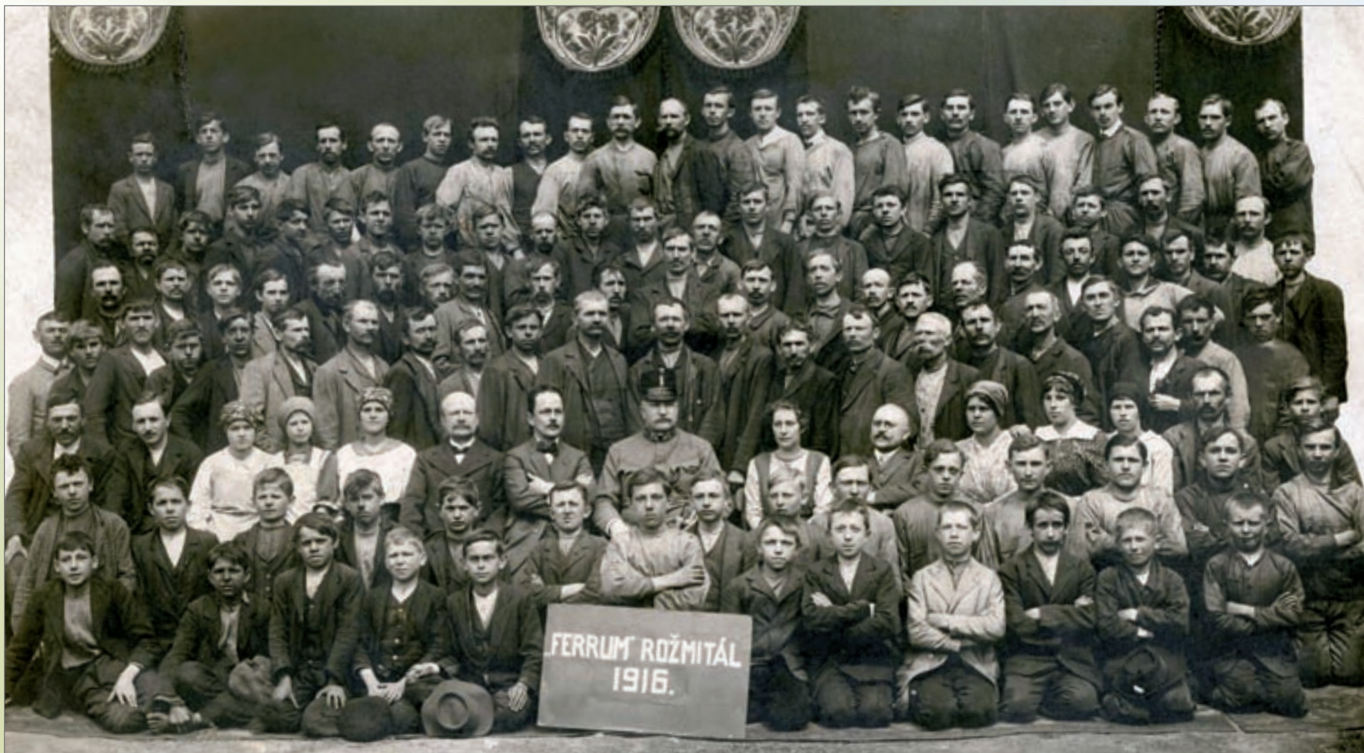
Zaměstnanci Ferrum a. s. v Rožmitále z roku 1916