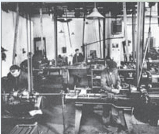
Pohon obráběcích strojů pomocí transmise