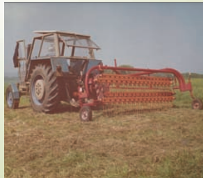
Obraceč / shrnovač OSP- 2