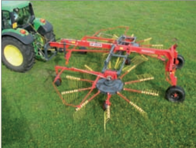
SP - 682D dvourotorový shrnovač na prostřední řádek