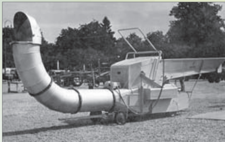
Výfuk kombinovaný s drtičem-VK25-II-strojírenská výstava Brno 1956