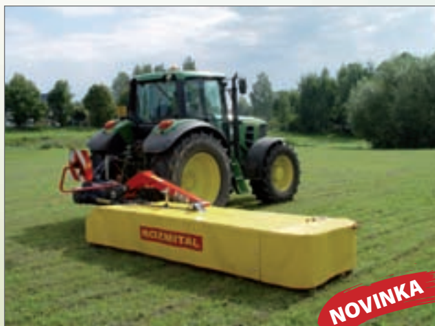
SD - 340, sekačka disková