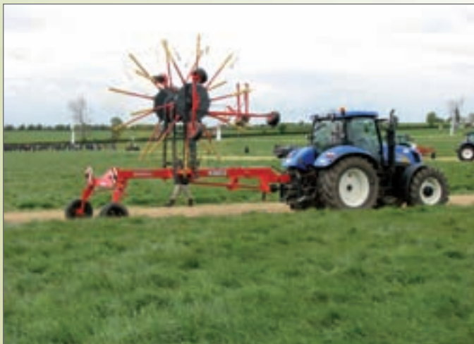
SP - 772D dvourotorový shrnovač na prostřední řádek