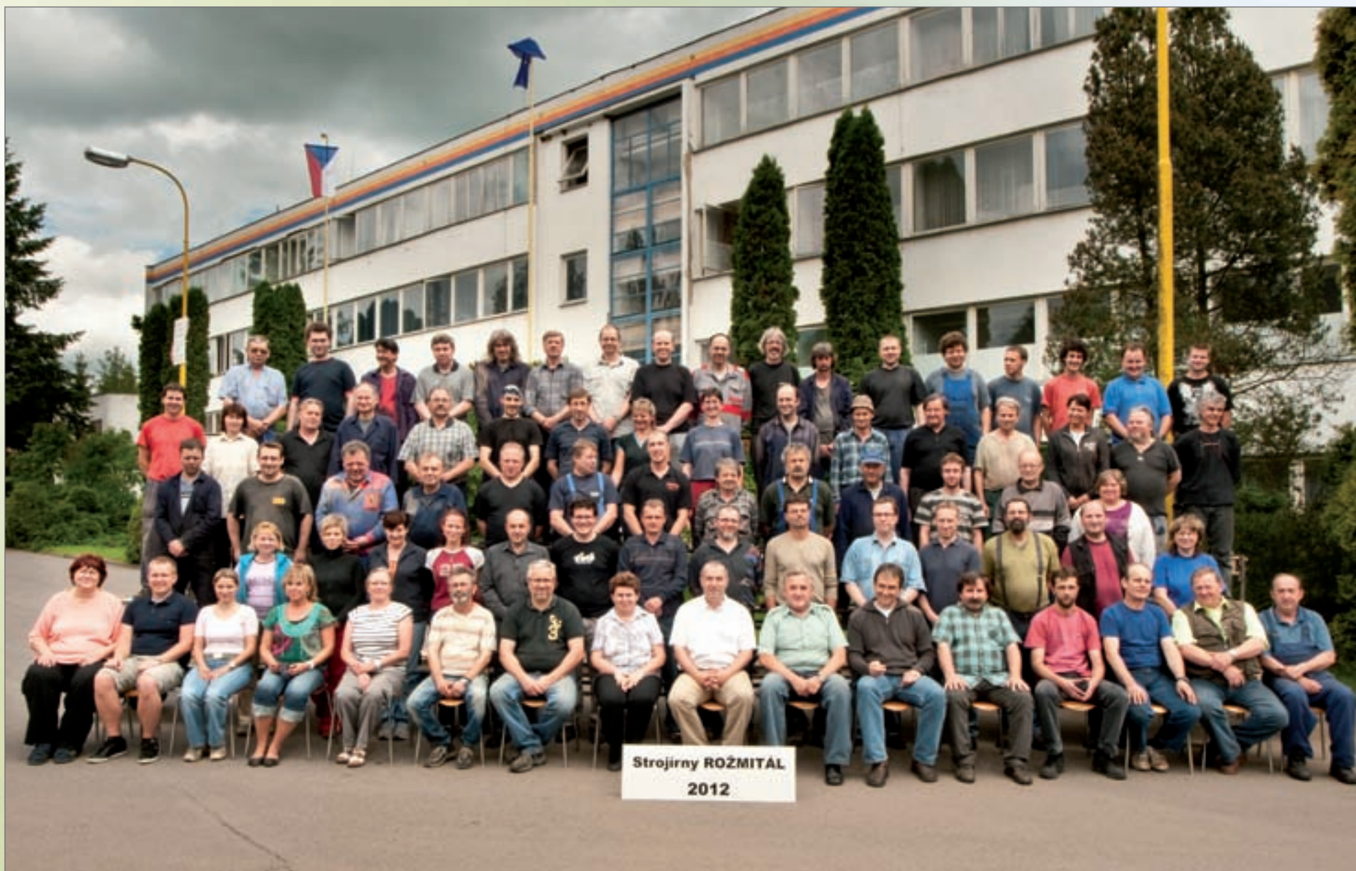
Zaměstnanci Strojíren Rožmitál v roce 2012