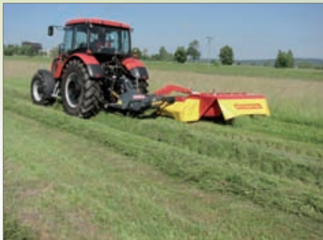
SD - 260C, sekačka disková s kondicionérem