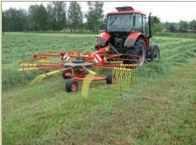
SB - 4631