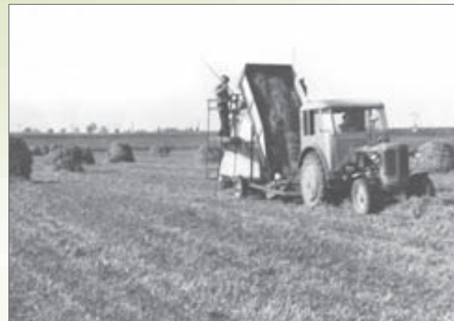
Sběrací kopkovač NPK-160, foto z roku 1958