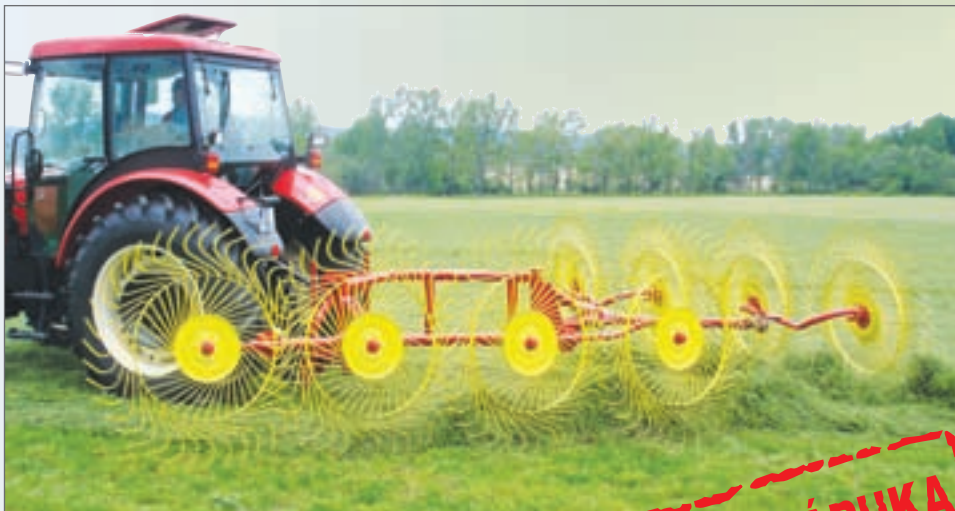
SP4-218 SHRNOVAČ NA PROSTŘENÍ ŘÁDEK