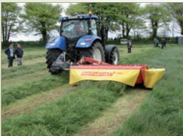
SD - 300C, sekačka disková s kondicionérem