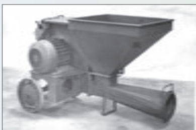
Zrnočet DoVZ-50, rok 1961