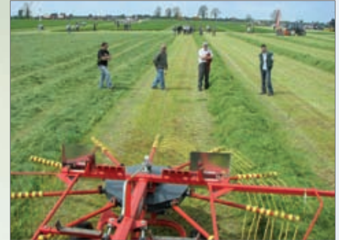
SB - 4231