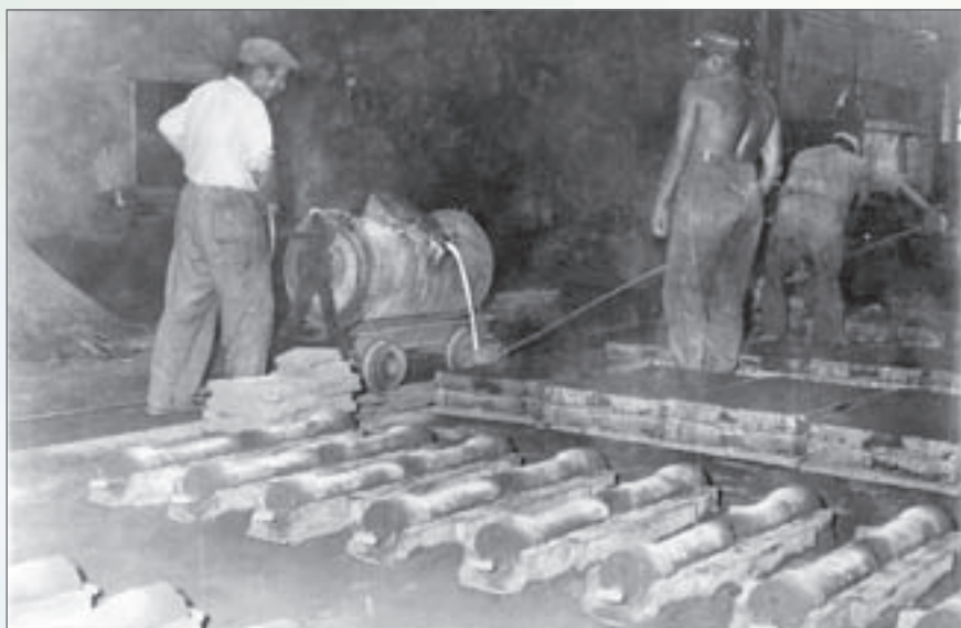
Dávkování kovu do ruční pánve