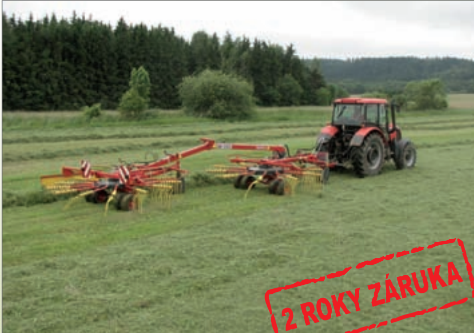
SB - 1352 dvourotorový shrnovač, boční