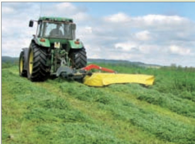
SD - 260, sekačka disková