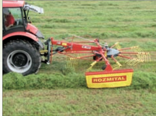
SB - 3921