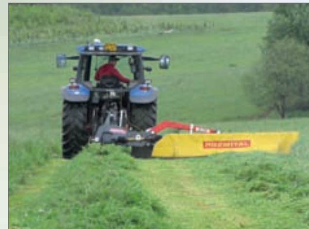
SD - 300, sekačka disková