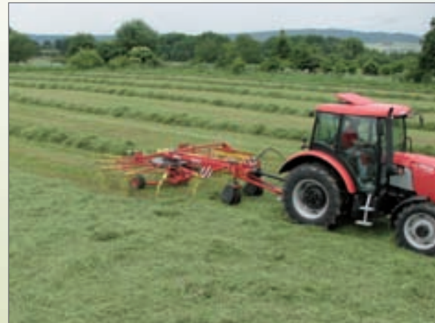
SB - 4941, tažený