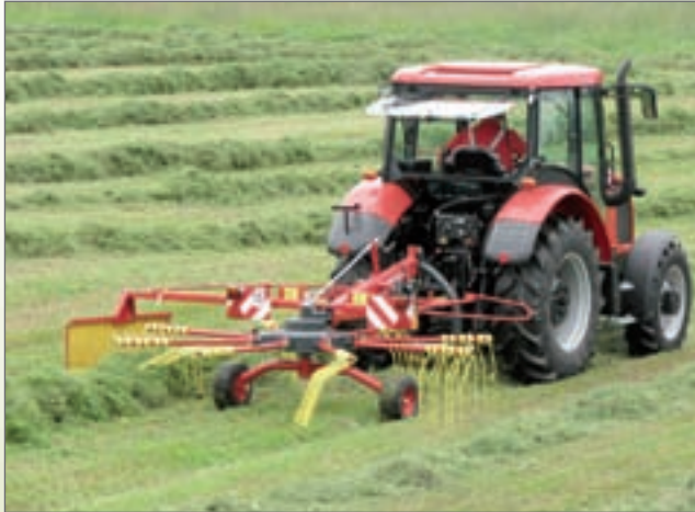
SB - 3621